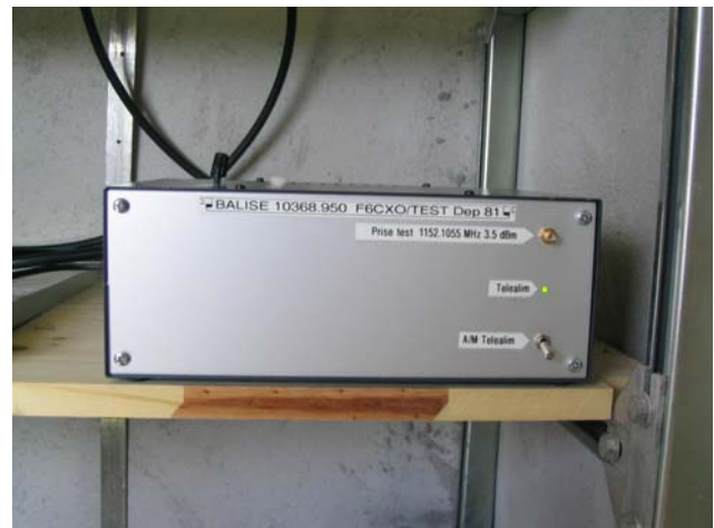
La balise dans la cahute de F5EMN