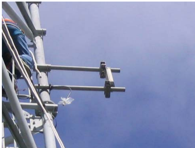
La balise en haut du pylône