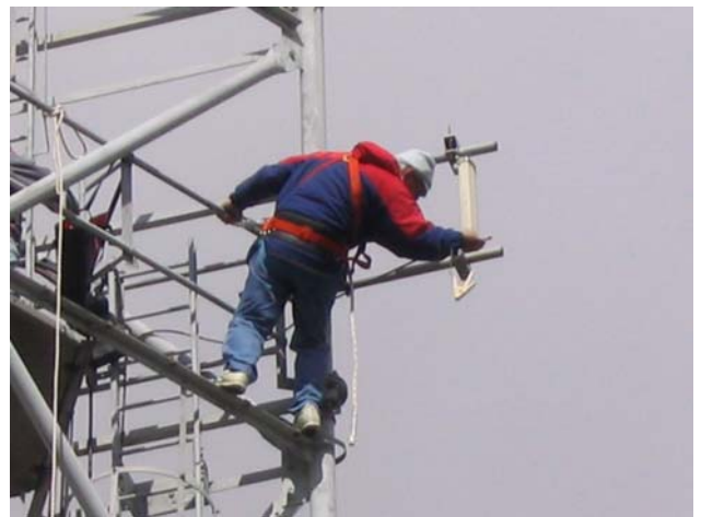
F6CXO qui joue le singe de service